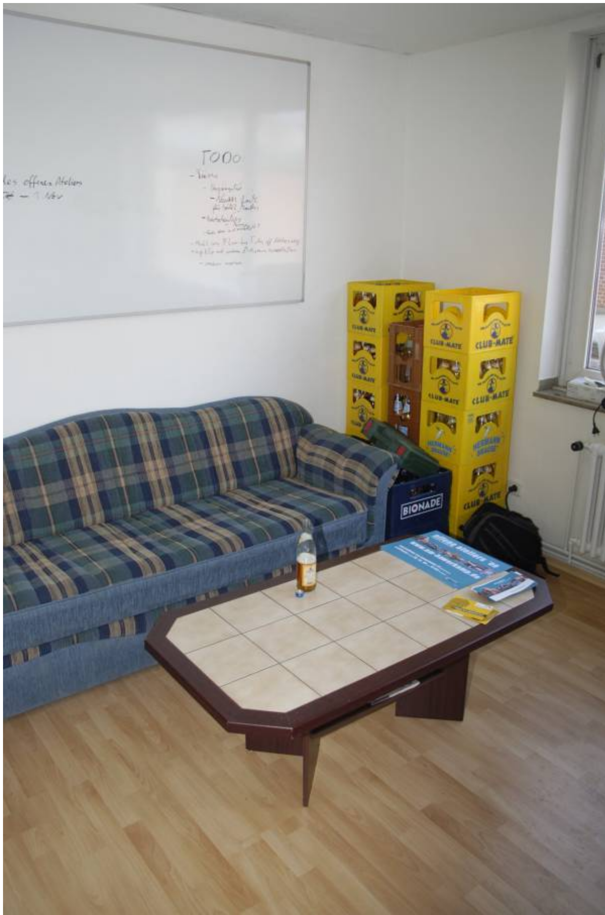
in die Chillzone.