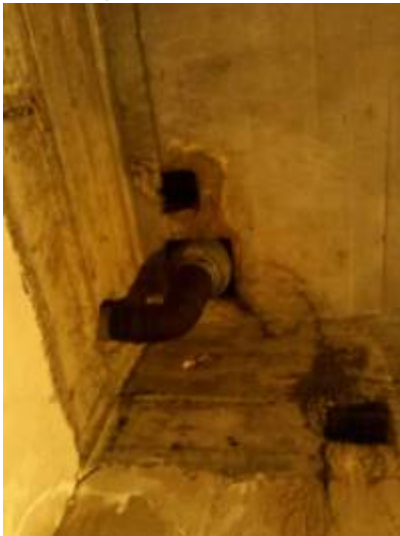
5. Hier wird es an mehreren Stellen unter der inneren Fensterbank nass. Die Fensterbauer haben hier auch noch das Plastikteil außen vergessen.