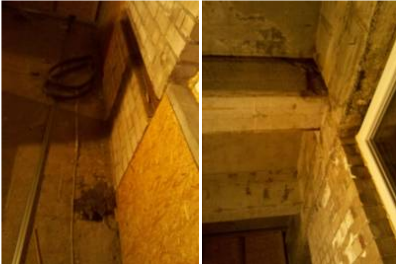
4. Hier tropft es aus dem Ausschnitt. Das Abflussrohr selbst scheint dicht zu sein.