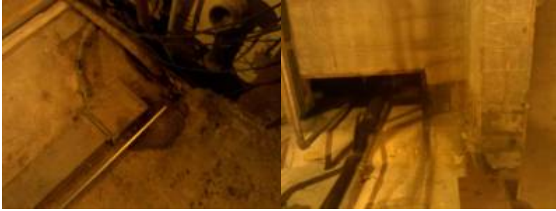
3. Hier tropft's vom Unterzug