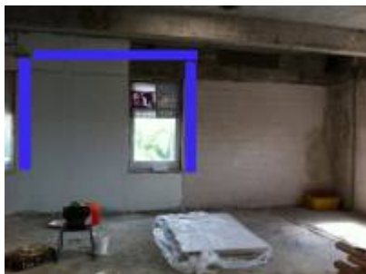
- 90% done