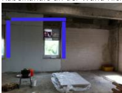
- 90% done